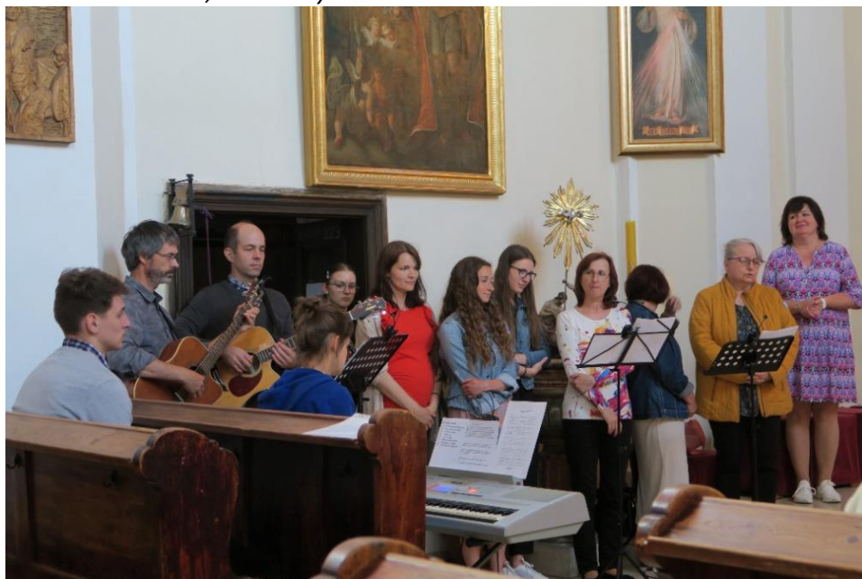
Foto z farní pouti rodin z Osové Bítýšky do Křižanova